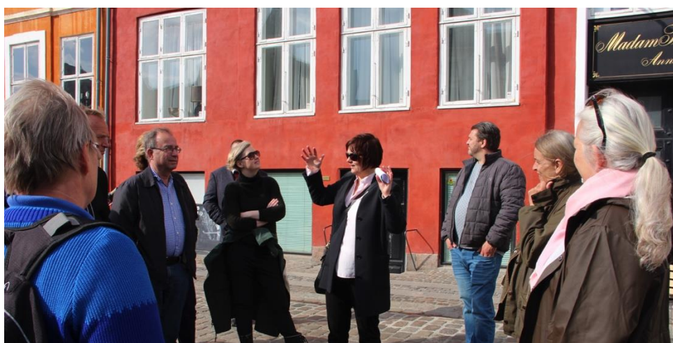
I dag kan man ifølge fredningsloven ikke frede bymiljøer, men kun enkeltstående bygninger. For at sikre et sted som Nyhavn, må man derfor frede hele husrækker.