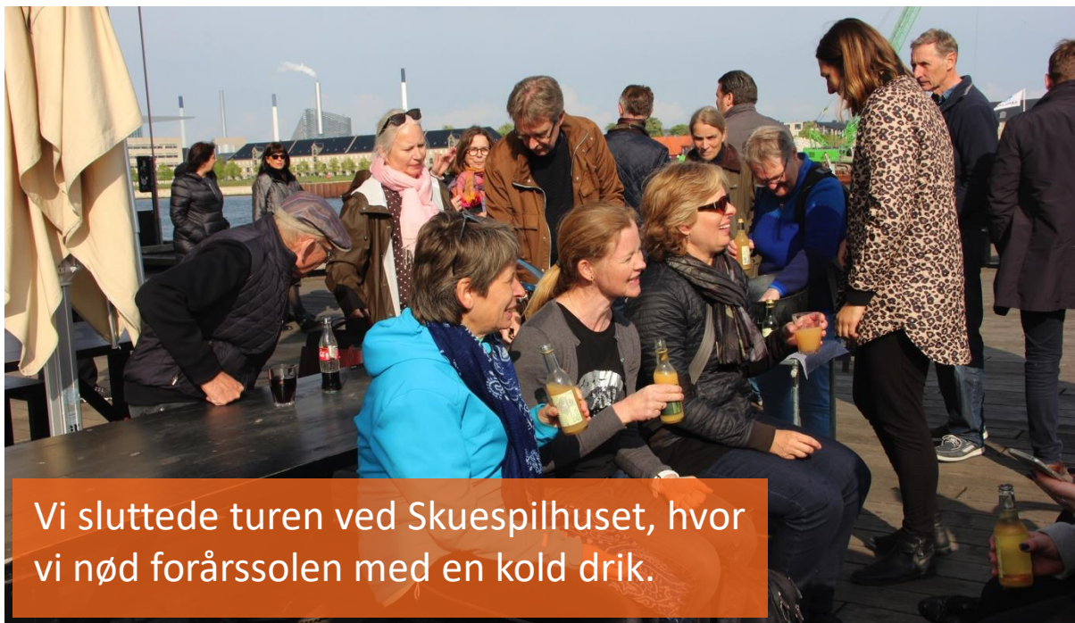
Vi sluttete turen ved Skuespilhuset, hvor vi nød forårssolen med en kald drik.