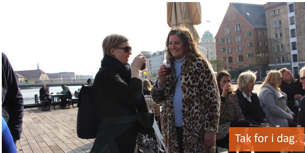
Tak for i dag.